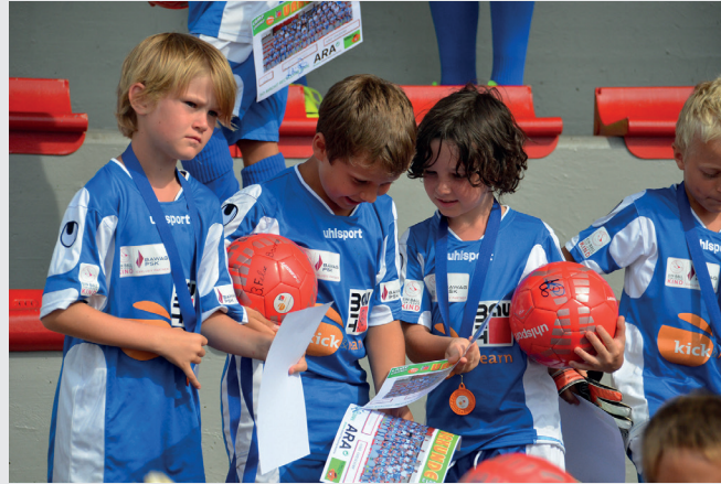
Freitag ist Camp-Champ-Tag